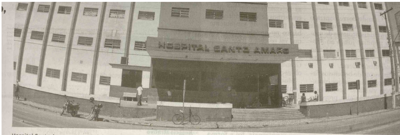
Hospital Santo Amaro esteve sob intervenção municipal por 15 anos, período em que a instituição acumulou dívidas aproximadas de R$ 70 mi