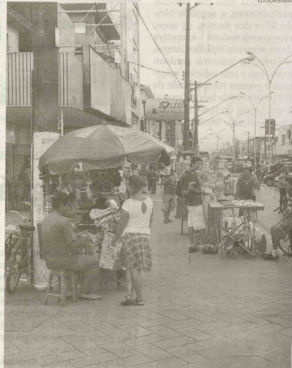
Produtos piratas, calçadas ocupadas, concorrência desleal: problemas

Um dos motivos, diz ele, é a migração ilegal de ambulantes. Aproveitando-se da falta