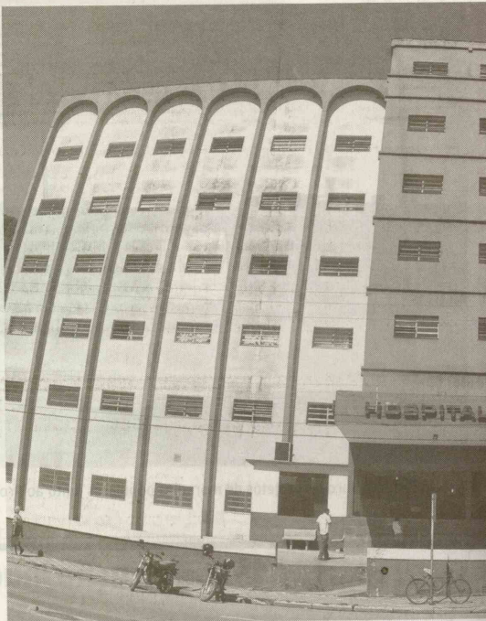
Hospital Santo Amaro esteve sob intervenção municipal por 15 anos, per

Este tipo de inadimplência é vedado pela Lei das Entidades Filantrópicas. “Será o fim, a gente vai quebrar e deixar de operar”, sentenciou.